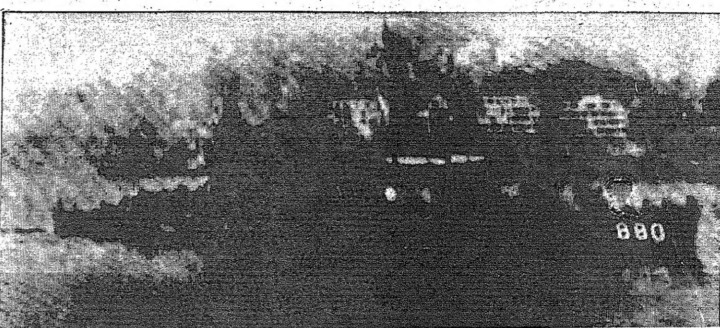
الجمعة الأمريكية (دبيس) وهي جناز مضيق اليوسفور باتجاه البحر الأسود صباح امس الباركر (صورة لاسلكية من نيويورك) بخاصة بالنستور

اميزات مقولة كما ان الجمهوريه العربية المتحدة والاردن على استعداد لذلك في حدود الخط لا التسليم والاستسلام. ان قيلت الوثائق بقرار مجلس الامن الداعي لتسحب اسرائيل من المناطق المحتلة وانها حالة الحرب مع اسرائيل مقابل منحها الملاحة الحرة في قناة السويس ومضائق تيران كسبا ان الجمهورية المتحدة وافقت على عودة قوات الطوارئ الدولية الى المناطق المحتلة.